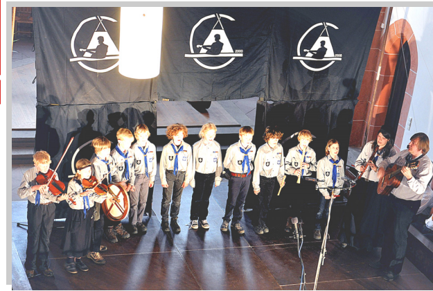
Rheinischer Singewettstreit in St. Goar

Weltpfadfinderorganisationen und Teil der Evangelischen Jugend.